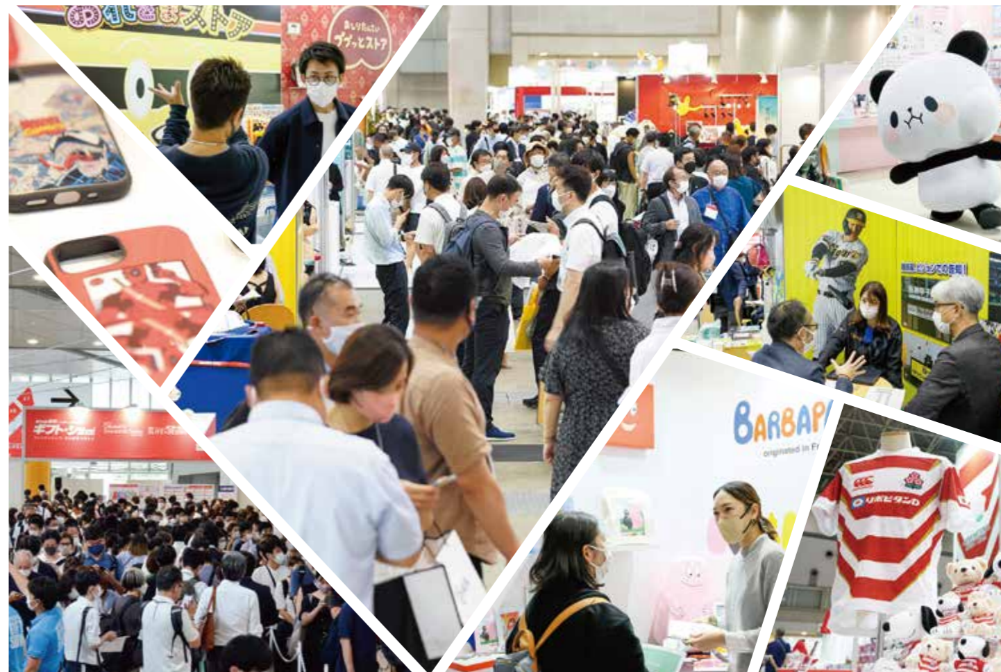
※過去のご出展社様の写真を使用しております